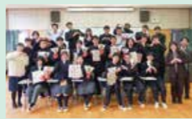
利用生徒一同(令和7年度)

自然環境科の特色ある教育を受けたい人を全国から広く受け入れるためのシステムです。現在は30名程度がこのシステムを利用しています。